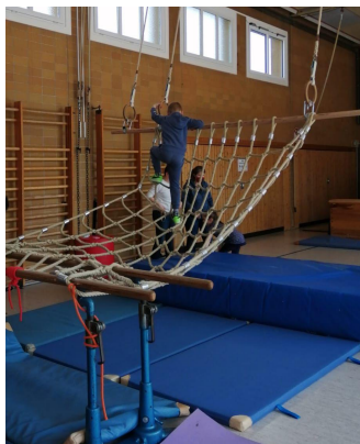
Projektwoche 2022 - Thema: Bewegung und Gemeinschaft