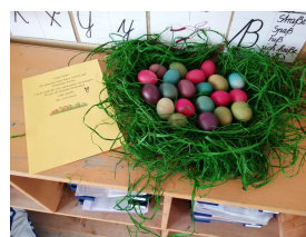
der Osterhase kommt